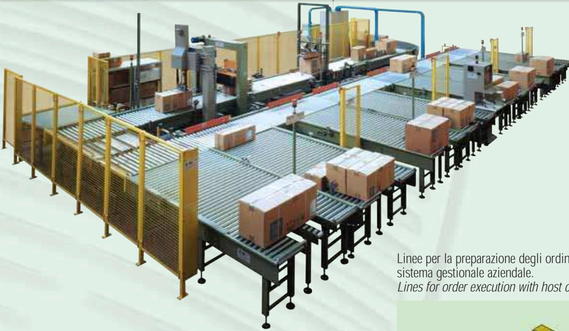
Linee per la preparazione degli ordini con interfacciamento in tempo reale al sistema gestionale aziendale. Lines for order execution with host computer interface in real time.

SIPI achieves the total integrated automation of the order and shipment execution process, with procedures that go from withdrawing goods from stock to loading them on trucks. SIPI End of line systems provides for parcel handling and packing, integration with data management and interface with host computer.