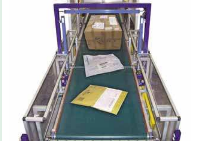
Linea per l'identificazione e la selezione automatica di plichi, buste e pacchi. Line for identifying and selecting covers, envelopes and parcels.

Fine linea per la preparazione e l'evasione degli ordini di parti di ricambio per il settore automotive. End of line system for preparing and shipping orders of spare parts for the automotive field.