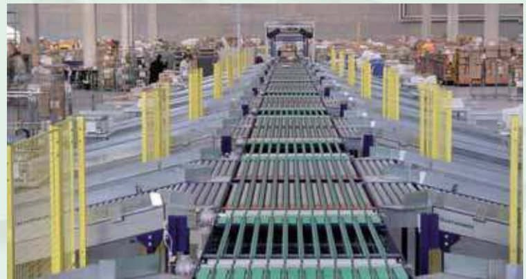
Impianto automatico di handling and sorting predisposto per l'identificazione dei colli, la rilevazione del peso e del volume e la destinazione in 32 baie di scarico. Automatic "handling and sorting" system for parcel identification, weight and volume acquisition, destination to 32 unloading bays.