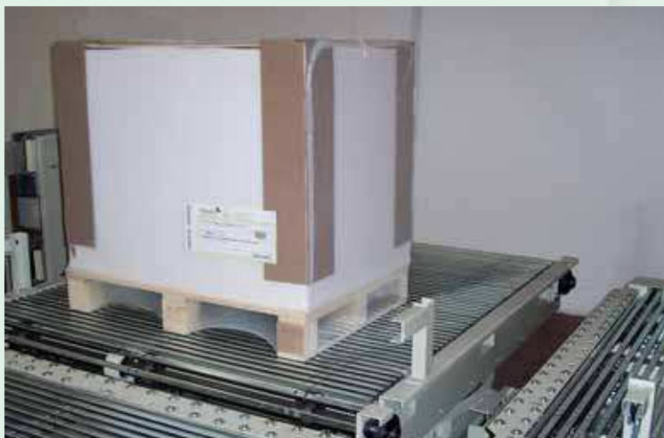
Fine linea per pallet con pesatura, imballaggio ed etichettatura sui due lati del pallet. End of line system for pallets, with weighing, packing and labelling on two sides of the pallet.