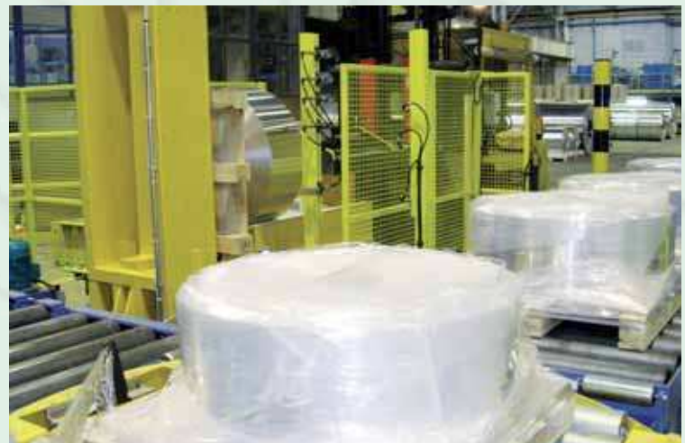
Fine linea per coils di alluminio su pallet con imballaggio, pesatura ed etichettatura. End of line system for aluminium coils on pallet, with packing, weighing and labelling process.