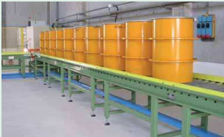
Sistemi di fine linea per fusti con pesatura ed etichettatura End of line system for drums, with weighing and labelling process.

I sistemi di fine linea Sipi prevedono la movimentazione ed imballaggio dei colli integrata con la gestione dei dati e possono essere interfacciati con il sistema gestionale aziendale.