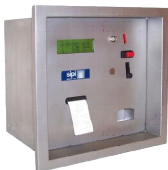
SE 511 SS Self Service SE 511 SS Self Service