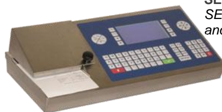
SE 500 I M290 Inox Grafico SE 500 I M290 stainless steel and graphic display