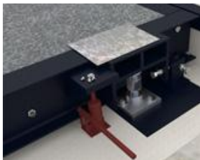
Cella di carico. Load cell unit.

Platform for motor vehicles built in metal or prefabricated cement.