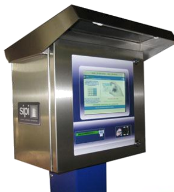
SIPI SERIE SISCO Gestione isole ecologiche SIPI SISCO SERIES Management ecological islands.