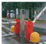
Controllo accesso automezzi e/o dipendenti. Access control for veichle / employess.