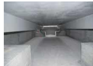
Particolare fondazione. Foundation detail.