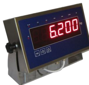
RIPETITORE SE 308 Inox Display H45 – IP 65 SE 308 I Repeater H45 Display – IP 65