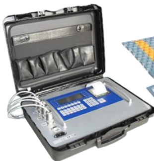
Indicatore di pesatura mobile. Mobile weighing indicator.