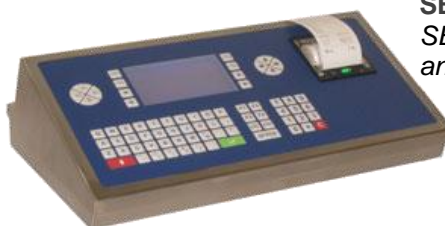
SE 500 I Plus Inox Grafico SE 500 I Plus stainless steel and graphic display.