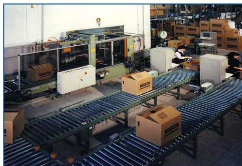
Linea di trasporto interno ed imballaggio di scatole con formatura automatica dei colli. Inside conveying line with parcel packing, and automatic box making.