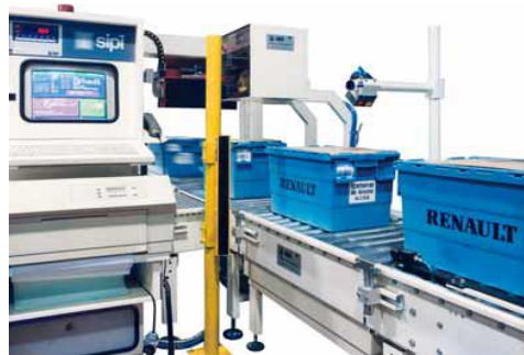
Fine linea per la preparazione e l'evasione degli ordini di parti di ricambio per il settore automotive. End of line system for preparing and shipping orders of spare parts for the automotive field.