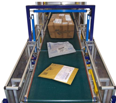
Linea per l'identificazione e la selezione automatica di plichi, buste e pacchi. Line for identifying and selecting covers, envelopes and parcels.

Sipi achieves the total integrated automation of the order and shipment execution process, with procedures that go from withdrawing goods from stock to loading them on trucks. Sipi End of line systems provides for parcel handling and packing, integration with data management and interface with host computer.