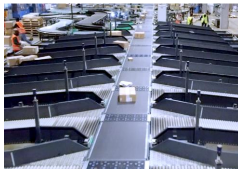
Impianto automatico di handling and sorting predisposto per l'identificazione dei colli, la rilevazione del peso e del volume e la destinazione in 32 baie di scarico. Automatic "handling and sorting" system for parcel identification, weight and volume acquisition, destination to 32 unloading bays.